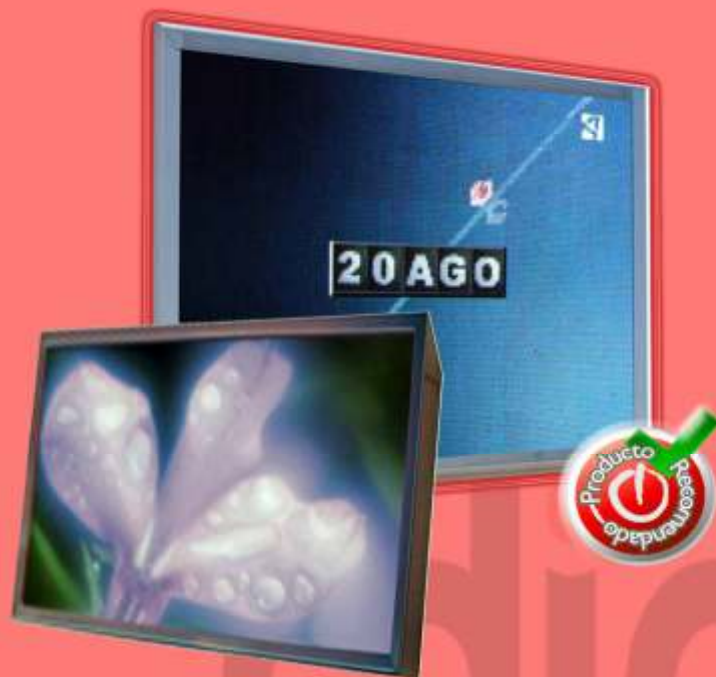
Modelo ON 10 Exterior HD