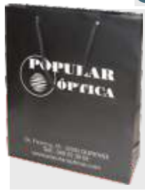
B-101 BOLSA DE REGALO PVC TAMAÑO: 12 + 6.5 x 16 cm. Cajas de 640 unds.