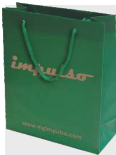
B-111 BOLSA DE REGALO PVC TAMAÑO: 40 + 12 x 50 cm. Cajas de 100 unds.