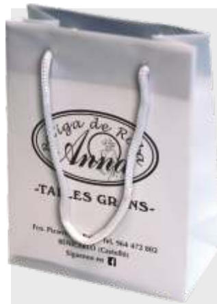
B-104 BOLSA DE REGALO PVC TAMAÑO: 26 + 8.5 x 32 cm. Cajas de 150 unds.