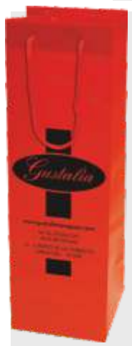
B-103 BOLSA DE REGALO PVC TAMAÑO: 11 + 10 x 36 cm. Cajas de 360 unds.