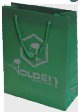
B-105 BOLSA DE REGALO PVC TAMAÑO: 31 + 9 x 39 cm. Cajas de 200 unds.